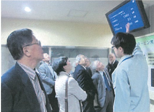
栃木県日光市(平成25年度)

23学区(地区)のコミュニティの会長が、他の市区町村などの先進的な取組を視察し、まちづくりに役立てることを目的に実施しています。視察先や内容は、コミュニティとしてのまちづくり方策や諸課題及び社会情勢などを考慮して決定しています。