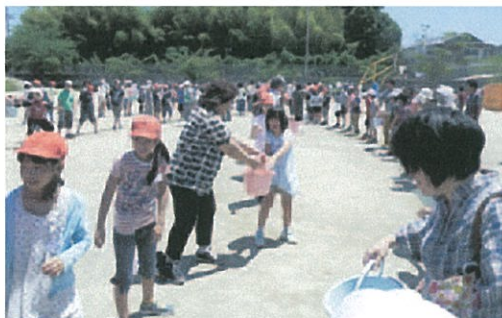
自主防災訓練(バケツリレー)