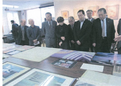
山形県山辺町(平成26年度)