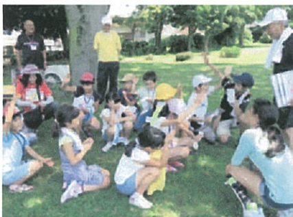
地域わんぱく隊事業