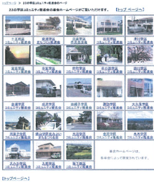
コミュニティ単会のホームページ