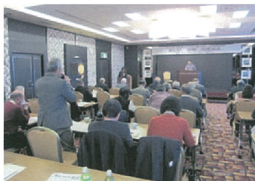
新春基調講演会(平成25年度)