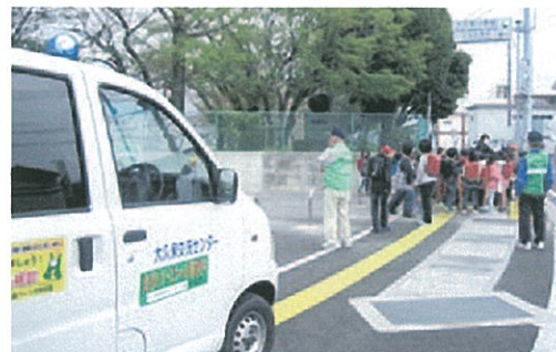
防犯パトロール活動