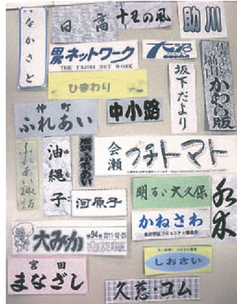
コミュニティ単会の広報紙(タイトル)