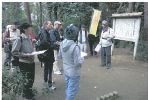
日立の魅力に触れる絶好の機会

「コミュニティマップ」が全学区において完成した平成11年に、「市政施行60周年記念・コミュニティマップで日立の魅力再発見ウォーク」として始まり、平成27年度で17回目となります。コミュニティマップをもとに考えられたウォーキングコースは、地域の特色が活かされるような工夫がされており、歴史や自然に触れることができる魅力的なものとなっています。