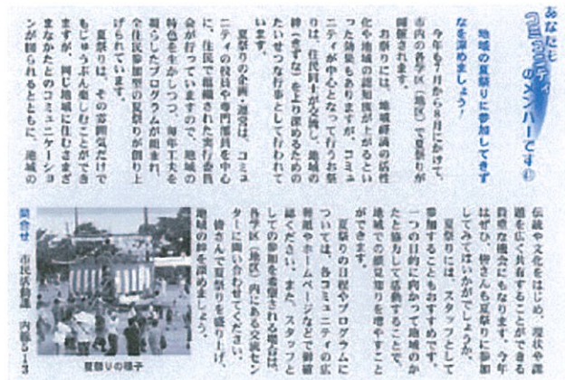
市報連載「あなたもコミュニティのメンバーです」