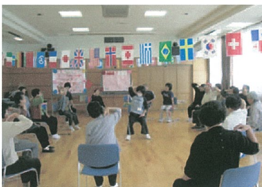
ふれあい健康クラブ事業