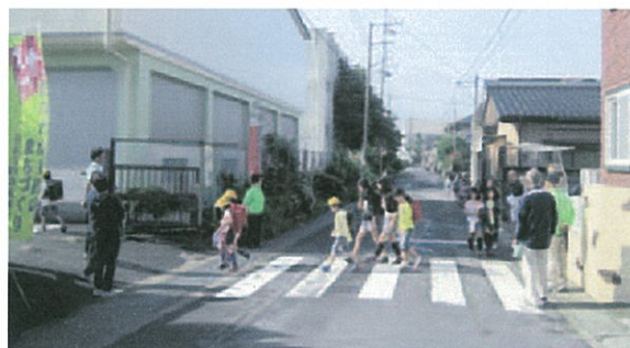
あいさつ声かけ運動