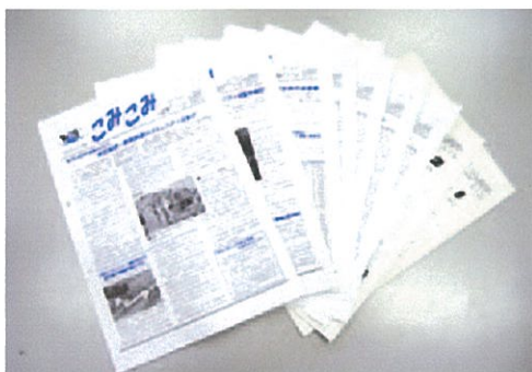
コミュニティ情報紙「こみこみ」

平成11年の第1号から、毎年2回発行している「こみこみ」は、市民に様々なコミュニティ活動の情報を伝える役割を担っています。「こみこみ」という名前には、「コミュニティ」「コミュニケーション」の頭文字のほか、コミュニティや日立市の資源などを「込み込み」で掲載していくという意味が込められています。