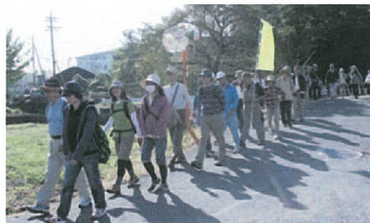
おしゃべりしながら楽しくウォーキング