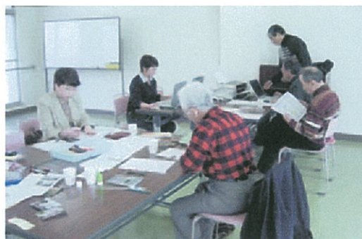
編集委員会の様子