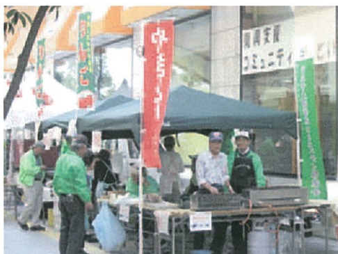
復興支援コミュニティのつどい(平成23年度)

昭和50年度に「市民運動推進者のつどい」として始まって以来、単会間の情報交換やコミュニティ活動のリーダーのスキルアップを目的とした事業を開催しています。